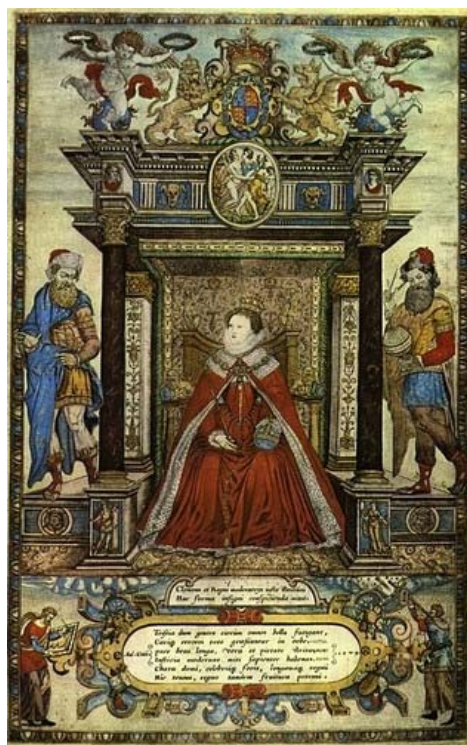
Fig. 1 Christopher Saxton, Atlas of England and Wales, 1574-1579, frontispiece.

Dans l'un des célèbres portraits d'Élisabeth I re que l'on peut voir à la National Gallery de Londres, le « Ditchley portrait » 1 , qui date de 1592, le corps même de la reine, tel qu'il apparaît dans le tableau, semble évoquer l'insularité de l'Angleterre et donne l'impression d'être une partie intégrante de la carte du pays dessinée sur le sol et dont la reine semble surgir ici comme un relief. Elisabeth est, en effet, une île dans ses représentations, dont celle de la reine vierge, territoire imprenable se confondant avec l'île forteresse que l'ennemi espagnol ne peut envahir, tout comme son beau-frère, Philippe II, veuf de Marie Tudor, n'avait pu la convaincre d'un mariage espagnol.