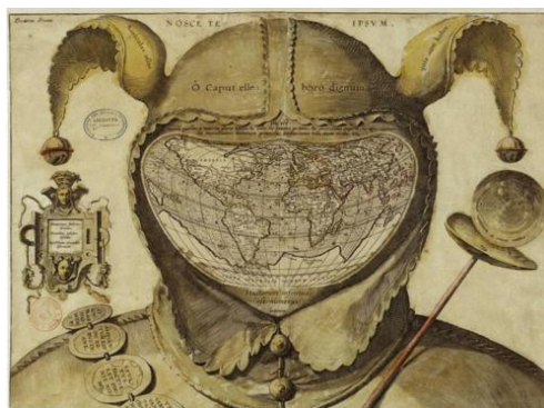
Fig. 2. O caput elleboro dignum [Monde dans une tête de fou], Oronce Fine, 1590.

L'insistance d'Élisabeth I re sur la nécessité de sa virginité, qu'elle affirme déjà dans une réponse au Parlement dès 1559, un an après son accession au trône, virginité ou chasteté dont on ne sait bien sûr si le terme doit se comprendre au sens strict ou s'il s'agit d'une métaphore de la vertu, renforce l'idée d'isolement corporel de la reine et d'une association avec l'île. Dans sa pièce de 1584 The Arraignement of Paris (Le Jugement de Pâris) , George Peele utilise un jeu de mot qui associe Élisabeth (Eliza) aux Champs Élysées (Elizium) : « The place Elizium hight, and of the place, / Her name that governes there Eliza is » 3 . Les Champs Élysées étant depuis Pindare (dans les Olympiques ) assimilés aux mythiques îles Fortunées (ou îles des Bienheureux), Élisabeth devient donc, chez Peele, la représentation spatiale de ces îles de légende, très souvent associées à l'Angleterre par les poètes de son temps. J'y reviendrai un peu plus tard.